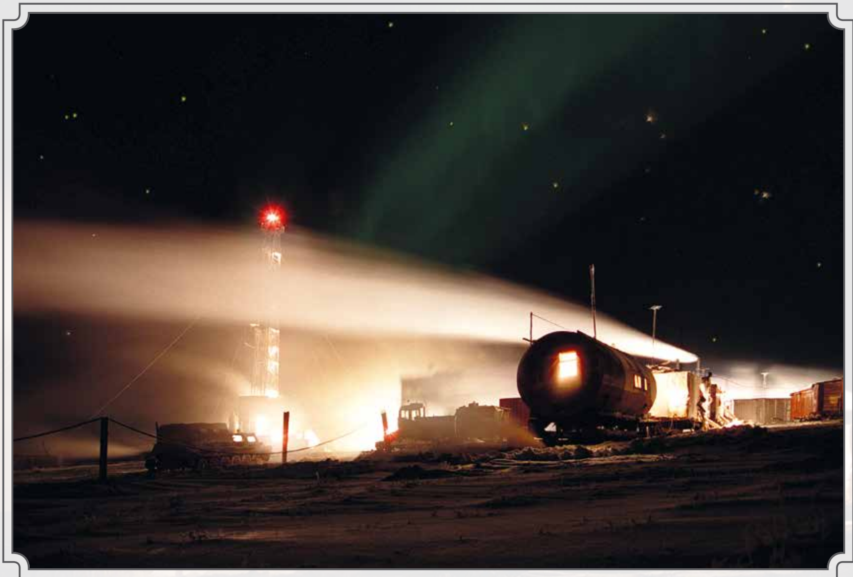
Экспедиция глубокого бурения