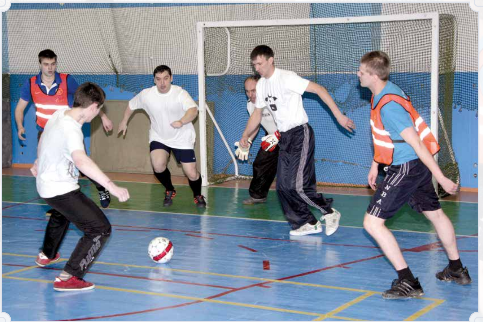
Жаркие моменты Спартакиады