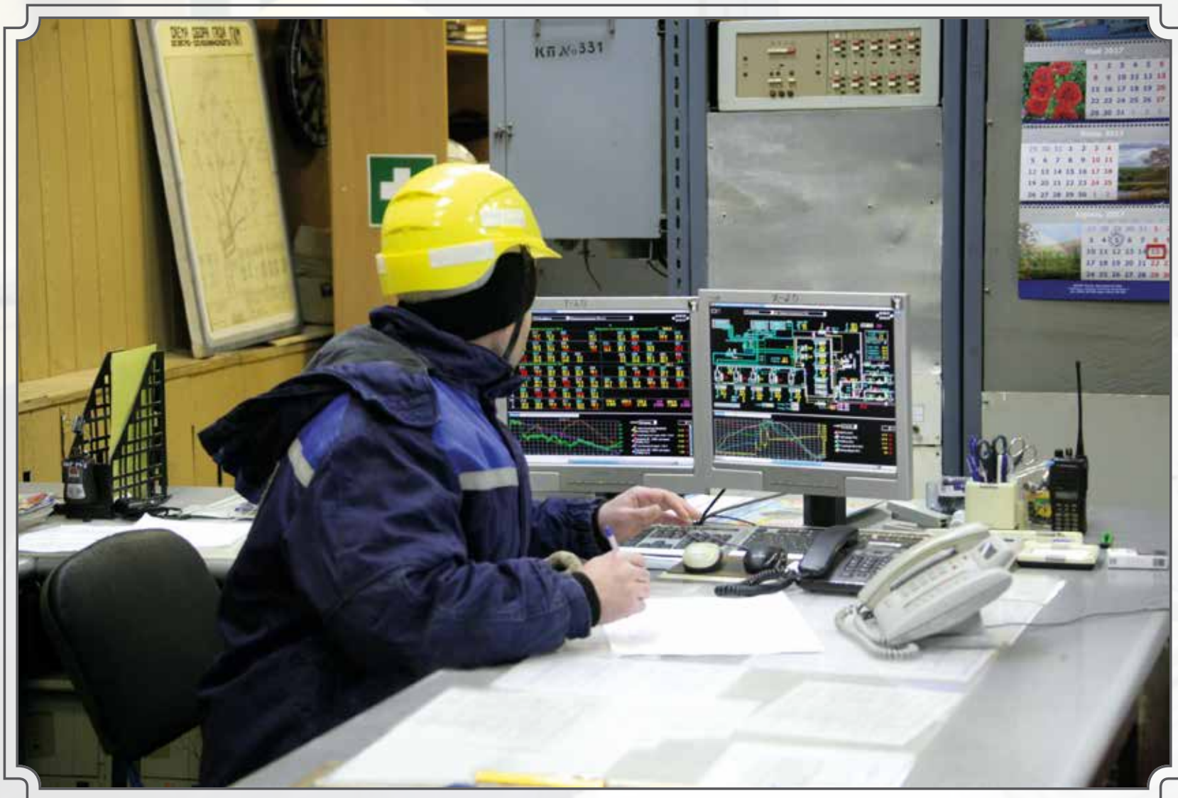
Параметры в норме