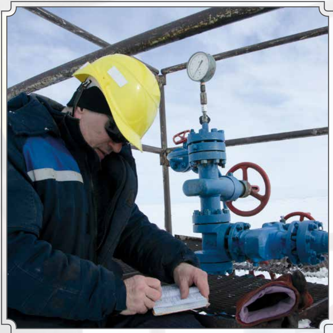
Учет и контроль