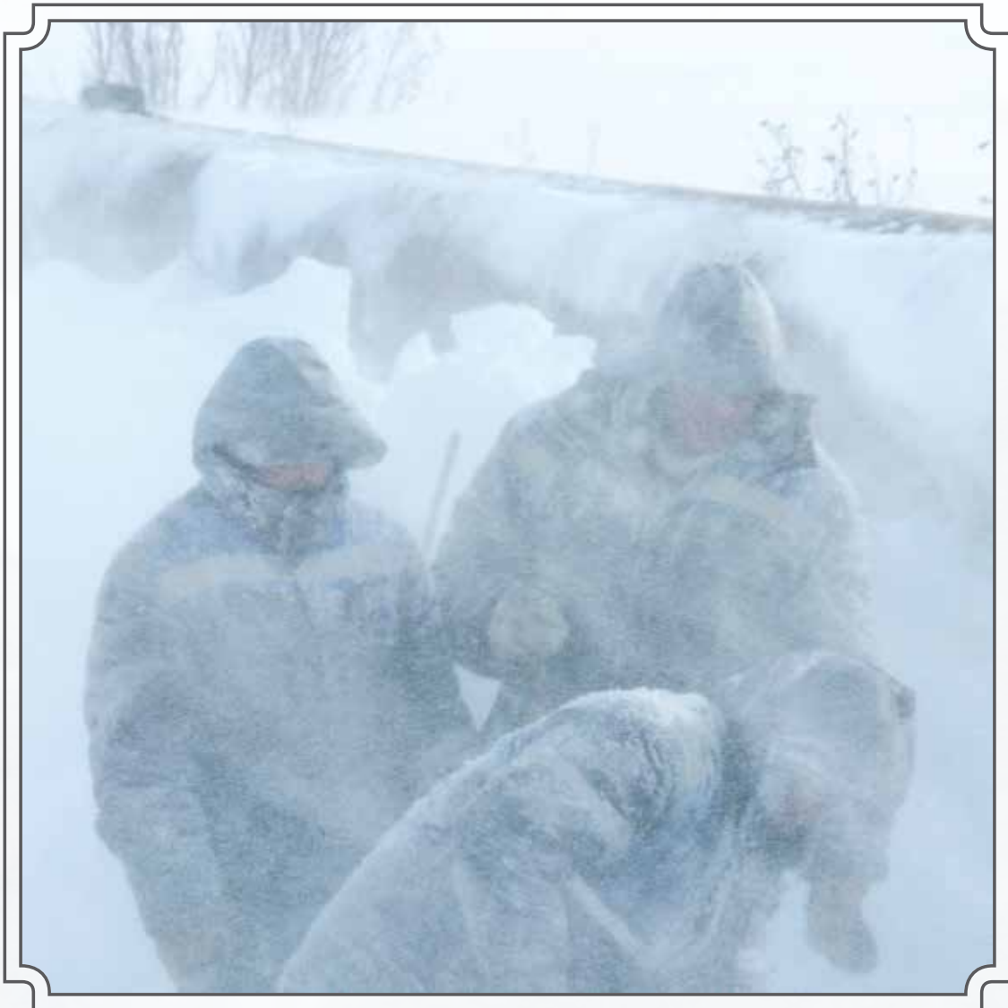
А для нас обычная погода