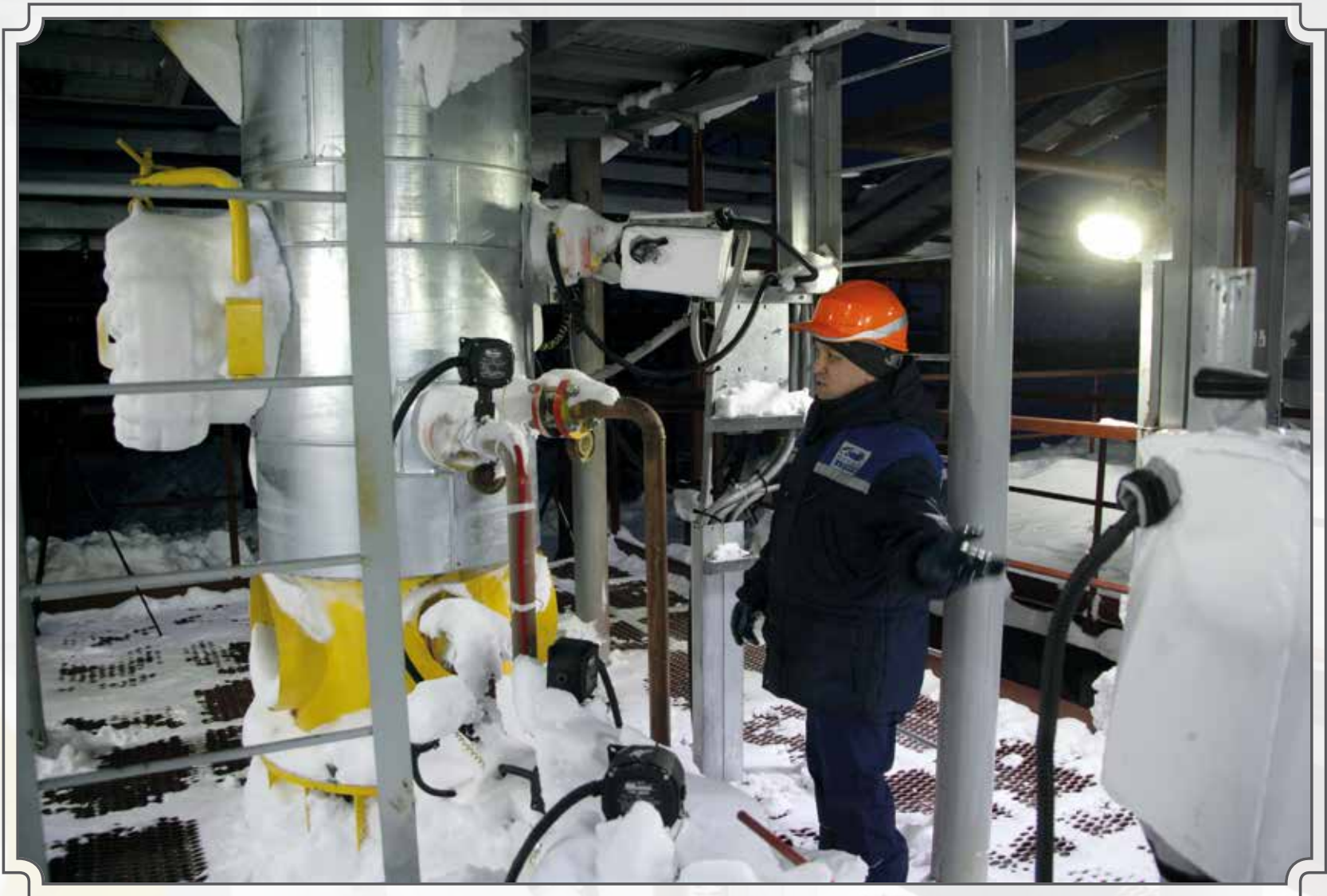
Подготовка газа к транспортировке