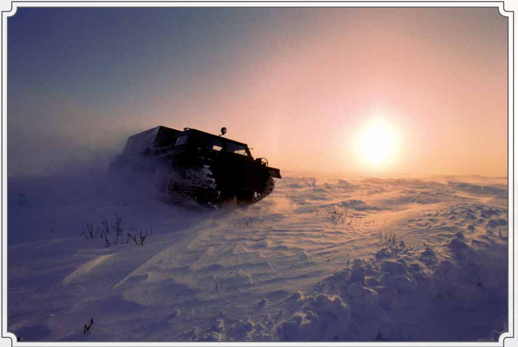
Мороз и солнце