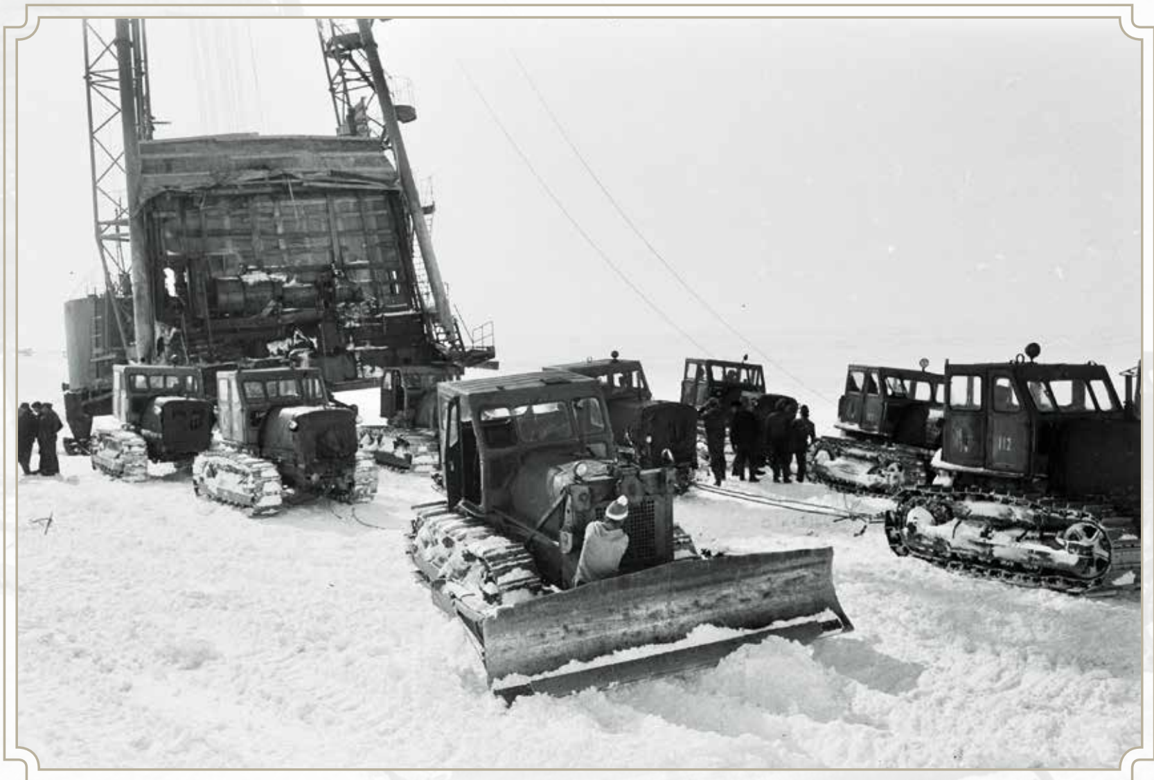
Разведка и бурение