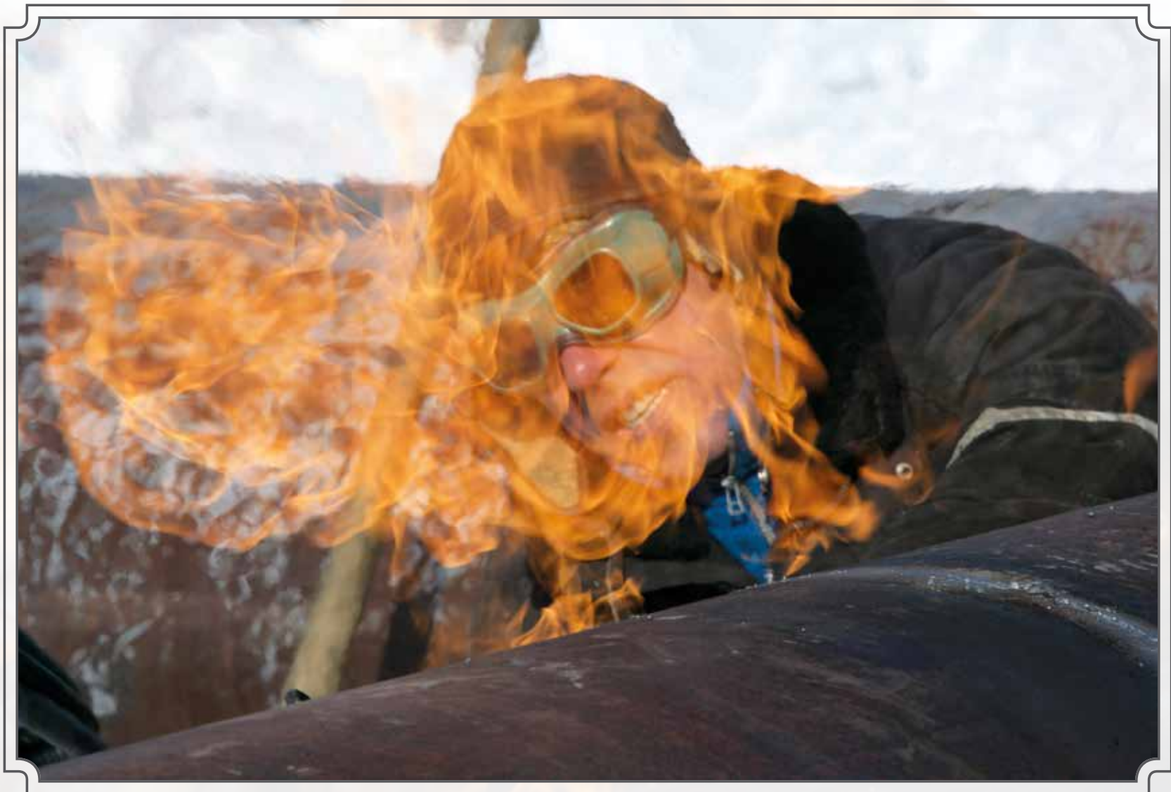
Сложнейшие огневые работы