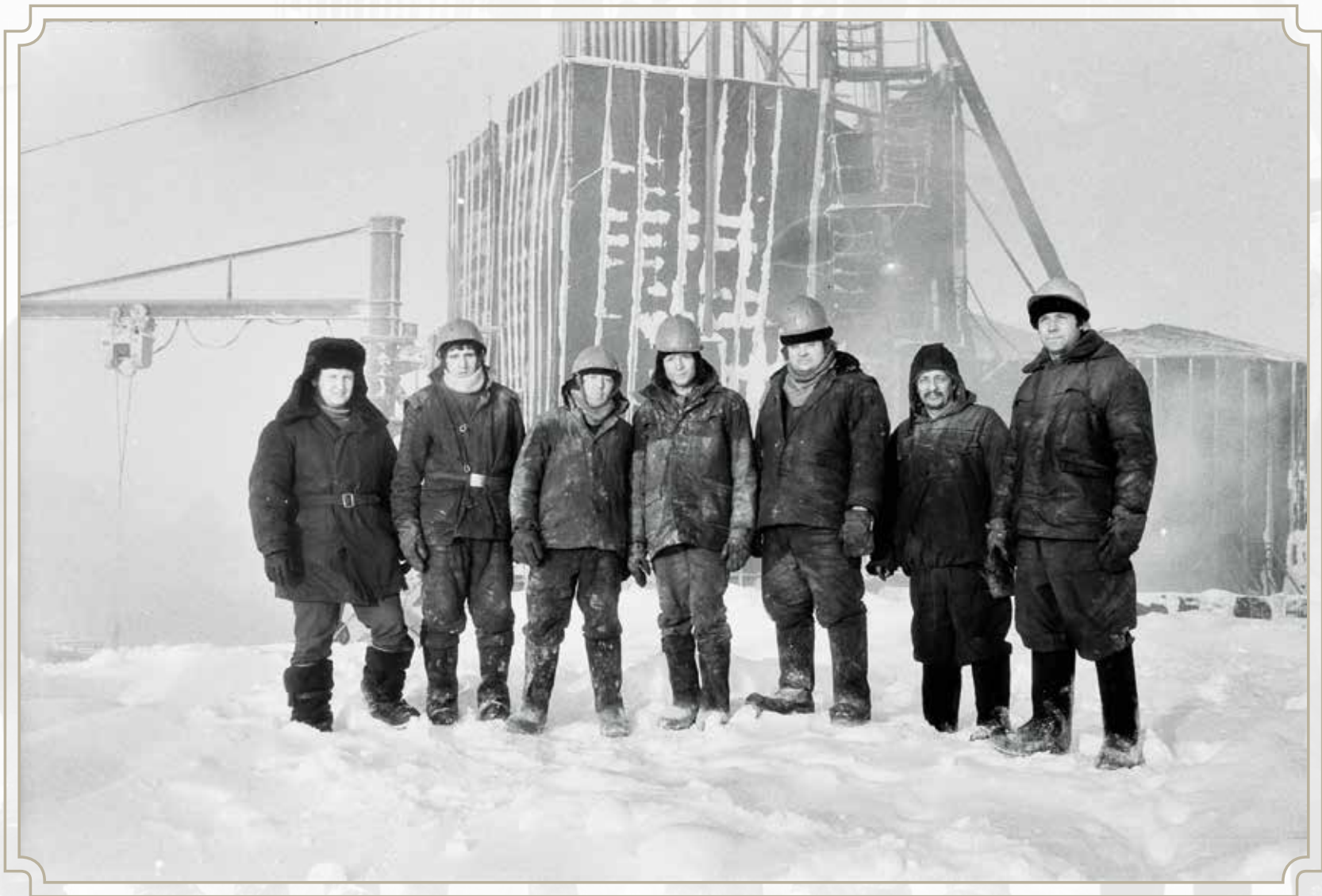
Ребята 70-й широты