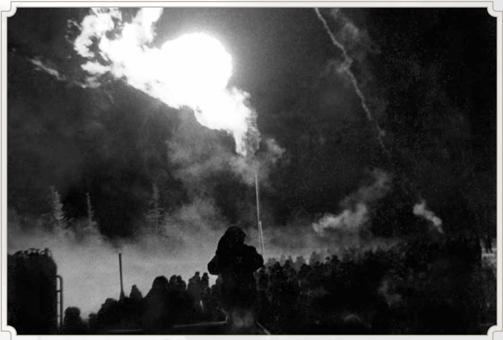
Газ в Норильске. ГРС-1