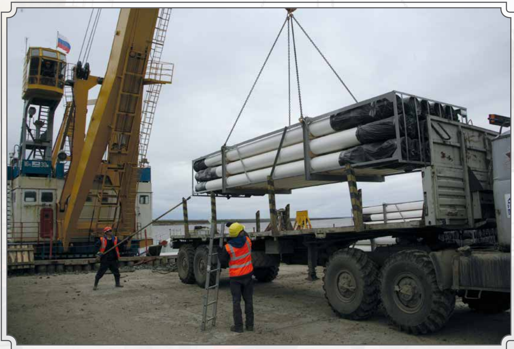
Навигация в разгаре